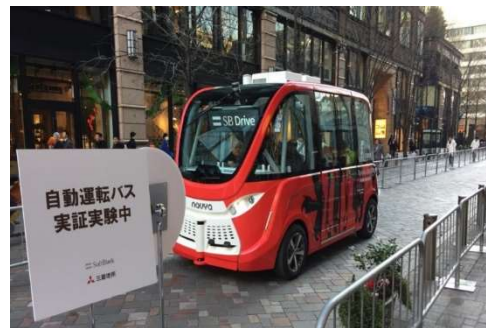
丸の内仲通り(公道)での自動運転バスの走行実証実験