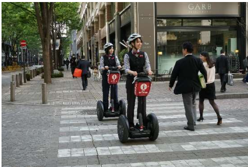
丸の内仲通り(公道)での「セグウェイ」の走行実証実験